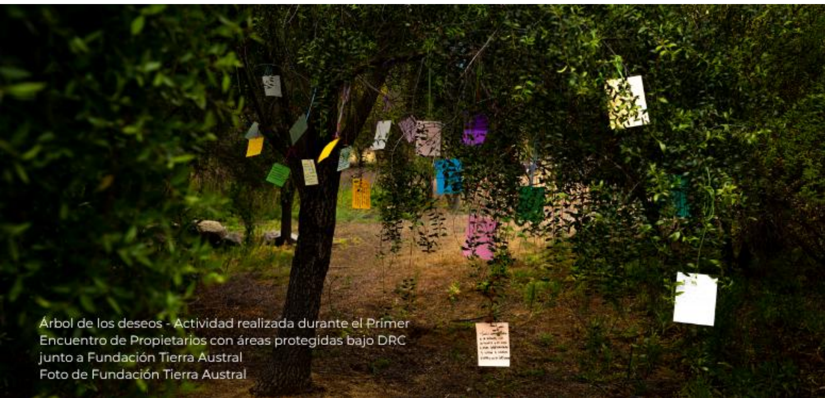
Árbol de los deseos - Actividad realizada durante el Primer Encuentro de Propietarios con áreas protegidas bajo DRC junto a Fundación Tierra Austral