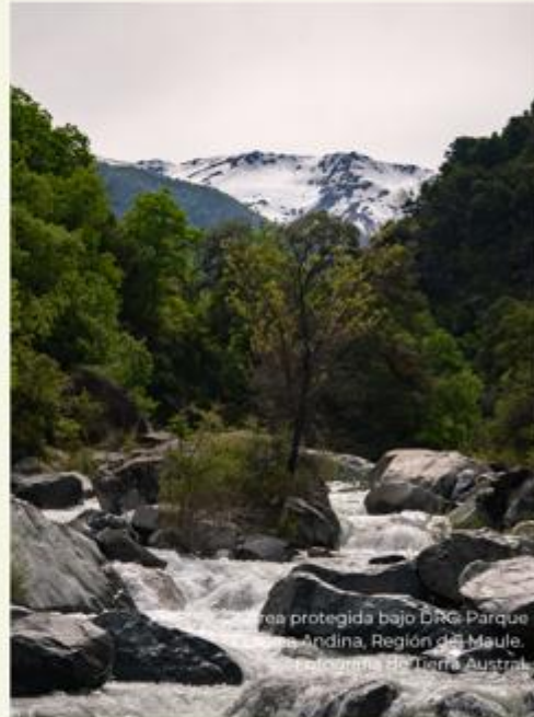
Área protegida bajo DRC Parque Cuenca Andina, Región del Maule. Ecosistema de Tierra Austral.

Impacto en la conservación: La conservación del Parque Cuenca Andina también ayudará a mantener la salud ecológica e hidrológica de la cuenca del río Teno, una fuente esencial de agua dulce, tanto a nivel local como nacional. Por último, la propiedad tiene una gran importancia cultural como un lugar donde los arrieros continúan con su uso histórico y sostenible de la tierra.