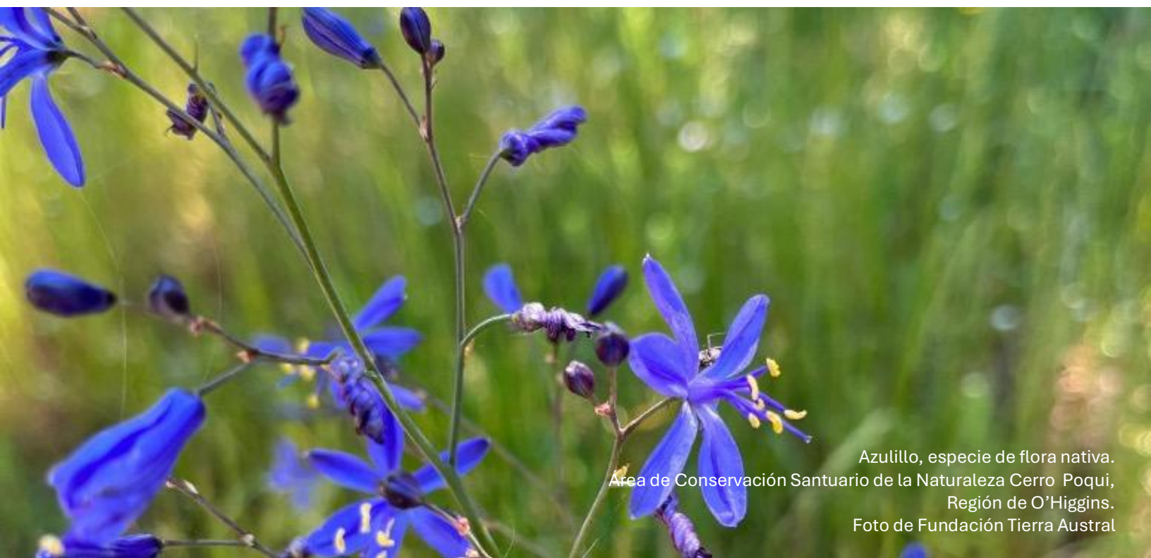
Azulillo, especie de flora nativa. Área de Conservación Santuario de la Naturaleza Cerro Poqui, Región de O'Higgins.

En esta etapa que comenzamos con entusiasmo y esperanza, reafirmamos la inspiración de Tierra Austral, la cual nos guía y proyecta hacia el futuro. Este marco conceptual recoge los elementos esenciales que sostienen nuestra identidad y lo que somos como Fundación: nuestra misión y visión, los principios que orientan nuestra forma de actuar, y los pilares estratégicos que estructuran nuestro trabajo por los próximos cinco años.