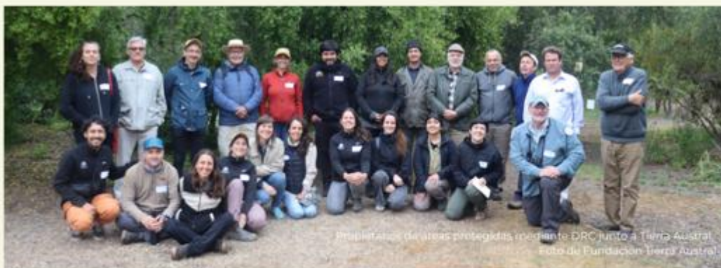
Propietarios de áreas protegidas mediante DRC junto a Tierra Austral.

El evento, realizado en el área privada protegida San Jorge, en la Región de Valparaíso, reunió a propietarios y miembros de equipos de distintas propiedades que van desde la Patagonia hasta Chile Central. Los propietarios pasaron el día conociéndose, compartiendo sus experiencias y reflexionando en conjunto sobre las oportunidades y desafíos de la conservación de tierras privadas en Chile. Fue una jornada emocionante, que ayudó a fomentar la colaboración futura entre nuestra valiosa comunidad de conservación.