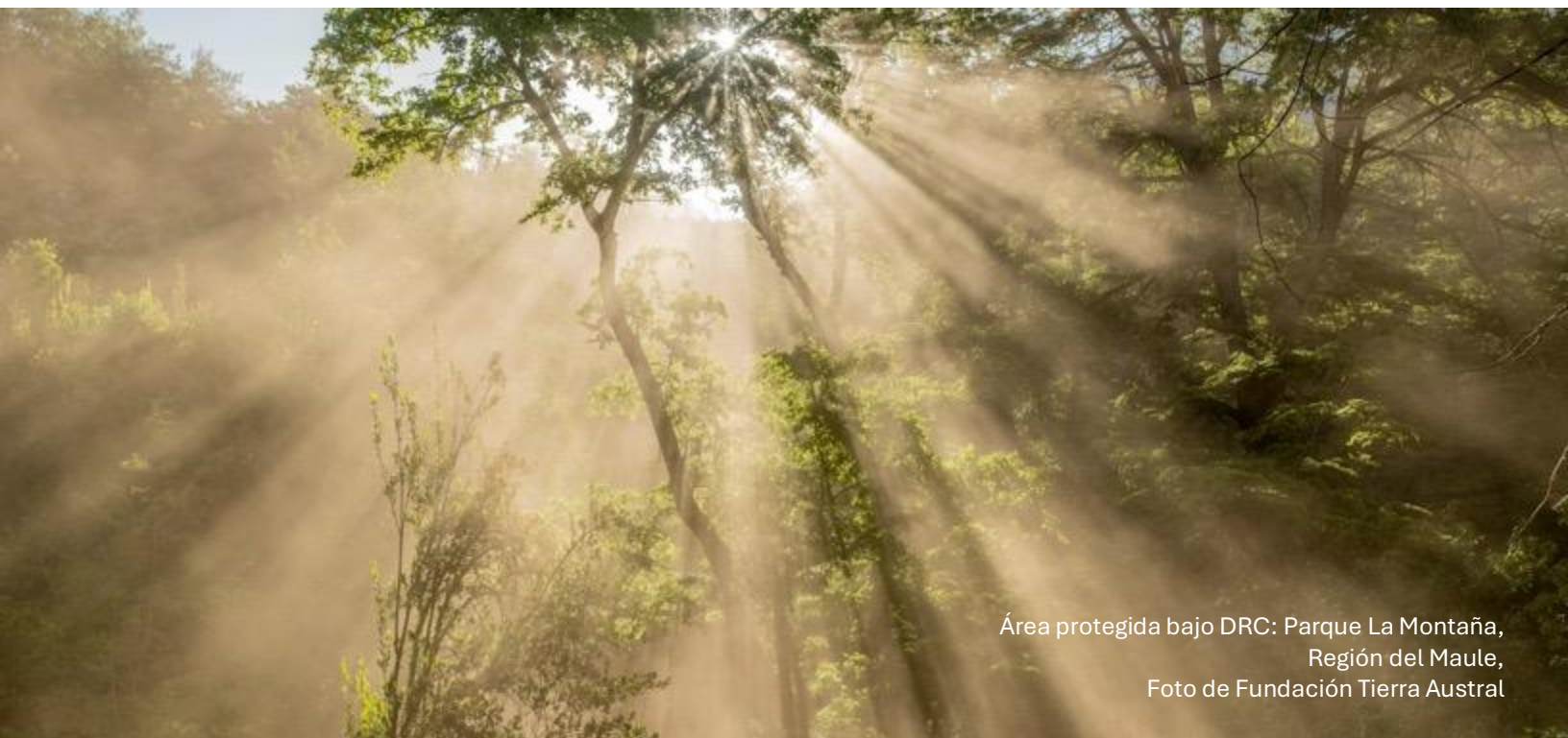
Área protegida bajo DRC: Parque La Montaña, Región del Maule

Con humildad, sabiendo reconocernos como un actor más en este camino de la conservación, aún incipiente en Chile; y con apertura, para nutrirse de otras experiencias nacionales e internacionales que nos ofrezcan inspiración, aprendizajes y oportunidades de colaboración; reconociendo que la conservación solo es posible como una tarea colectiva.