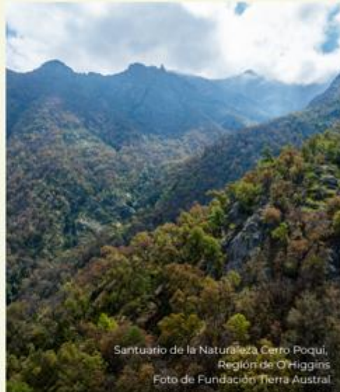
Santuario de la Naturaleza Cerro Poqui, Región de O'Higgins

Impacto en la conservación: Fundación Tierra Austral estableció un marco de gobernanza en coordinación con representantes de la comunidad local, orientado a desarrollar y adaptar el Plan de Manejo del Santuario y abordar una de sus principales amenazas: el turismo no regulado. Este proceso permitió regular las visitas de manera equilibrada y sostenible. En la actualidad, el Santuario Cerro Poqui es reconocido como un referente en conservación privada, vinculación comunitaria y educación ambiental, habiendo recibido a más de 1.000 estudiantes.