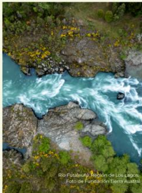
Río Futaleufú, Región de Los Lagos.

Como parte de este trabajo en conjunto, Fundación Tierra Austral brinda apoyo técnico a Futaleufú Riverkeeper para fortalecer su desarrollo organizacional y su rol como un potencial land trust en la zona.